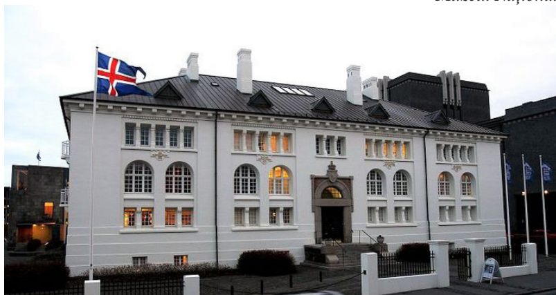
Muzeul de Artă