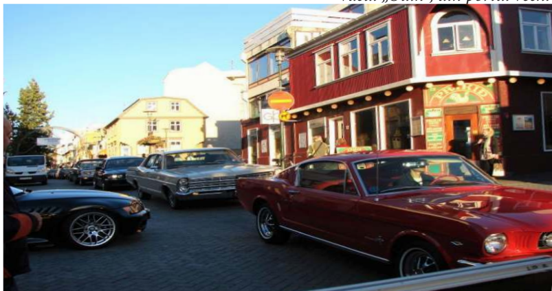
Parada mașinilor de epocă