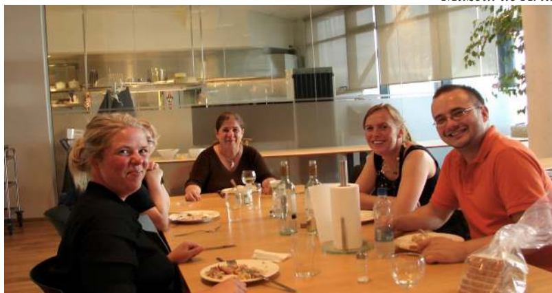
Demonstrație de gastronomie românească pentru echipa CCP