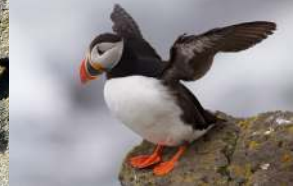
Pufini - Insula Vigur