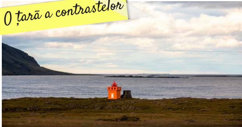
Belvedere de pe Marele Cerc