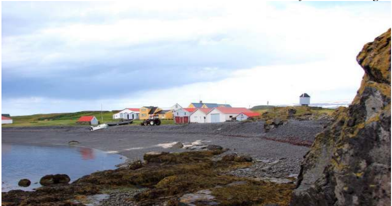
Issafjordur - Insula Vigur