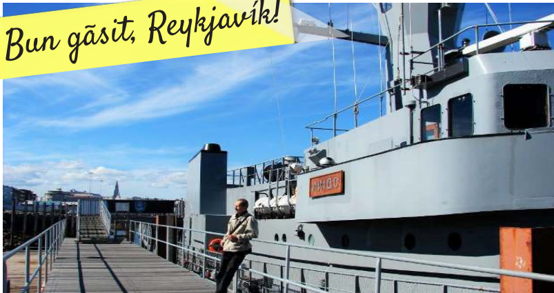
Vasul „Odin”, din portul vechi