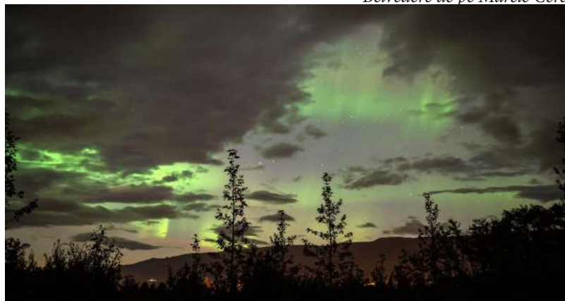
Auroră boreală lângă Muntele Fagradalsfjal