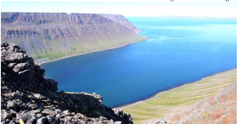
Panorama fiordului Issafjordur